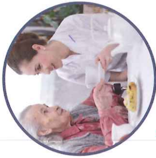
A ide aux repas