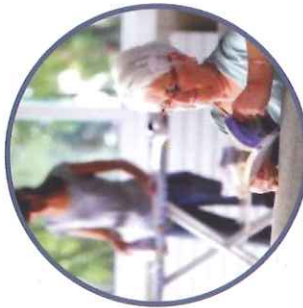
E ntretien du logement