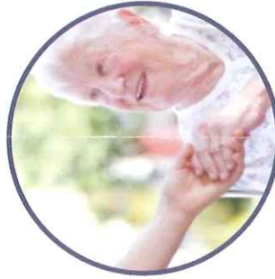
G arde de jour