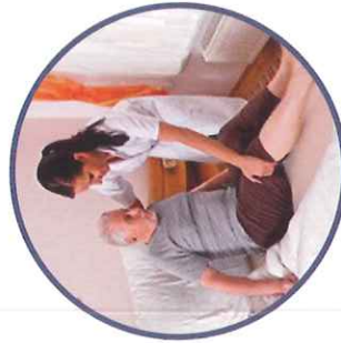
A ide au lever / au coucher A ide à la toilette