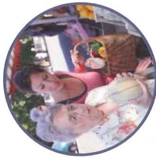
A ide aux courses